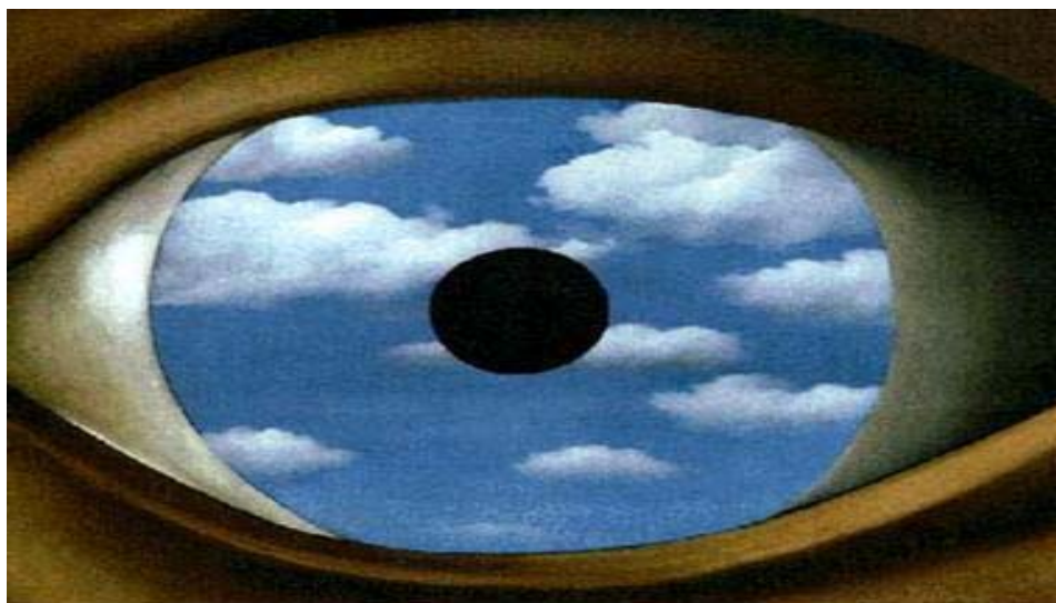
El espejo falso. Rene Magrite.1935

Apuntes sobre la economía furtiva del capitalismo.